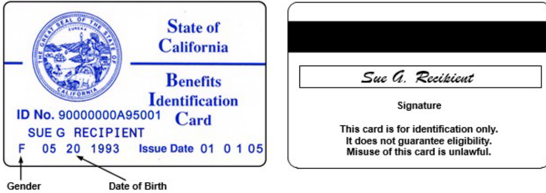
Sample BIC (Actual card size = 3 ¼ x 2 ¼ inches; white card with blue letters on front, black letters on back.)